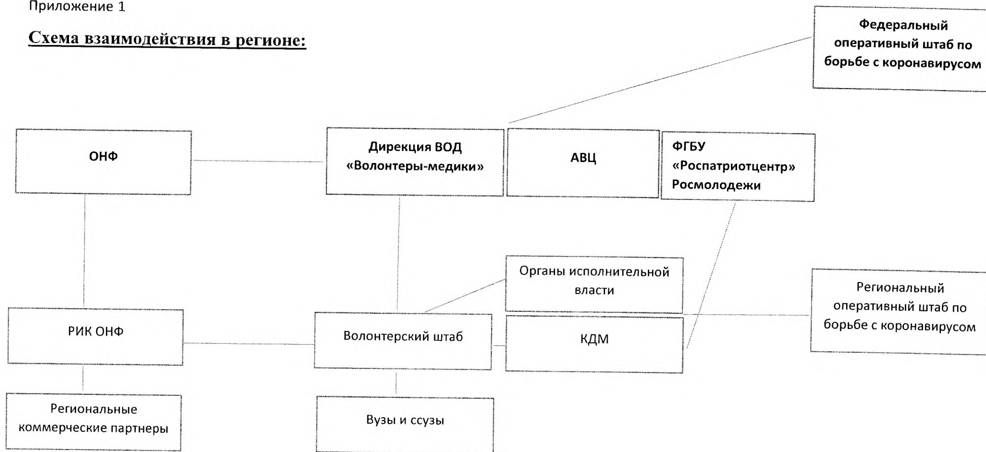
Схема взаимодействия в регионе: